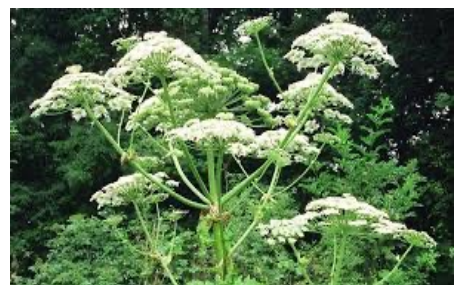
Riesenbärenklau Berce du caucase

Invasive Neophyten verdrängen die angestammte Vegetation, bedrohen die Biodiversität und können grosse Schäden an Infrastruktur und Gesundheit verursachen. Darum ist eine Bekämpfung notwendig (z.B. ausreissen und entsorgen).